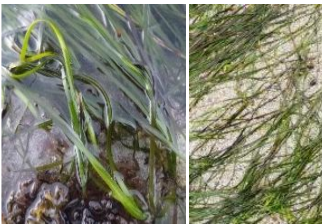
Angiospérmicas marinhas (Ervas marinhas - Zostera sp. ou Cymodocea sp. )