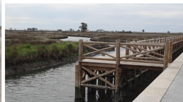
Cais da Ribeira de Esgueira