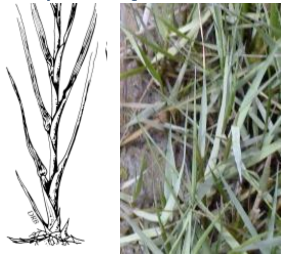
Spartina sp. (em bancos de vasa de sapais, estuários e rias)