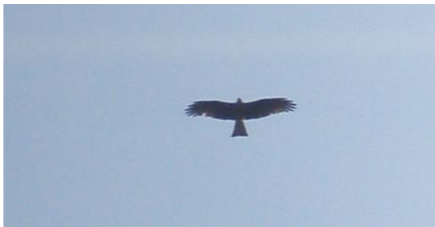
Milhafre Preto Milvus migrans (Boddaert)